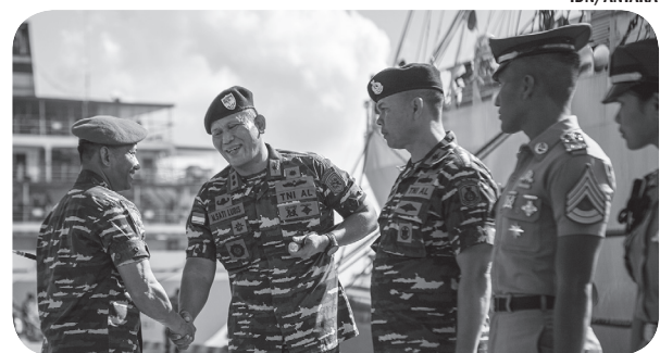
KRI BIMA SUCI TIBA DI BALI

Pertemuan semacam ini menurutnya adalah upaya untuk mendorong persamaan persepsi ke depan. Terutama di tengah ketidakpastian global. "Sehingga ini kita dorong untuk memperkuat solidaritas," kata Airlangga. ● mei